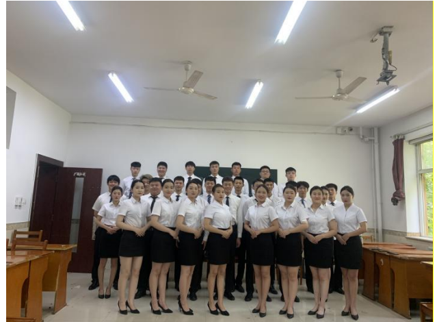
图 11 21 级空中乘务专业学生日常上课状态图