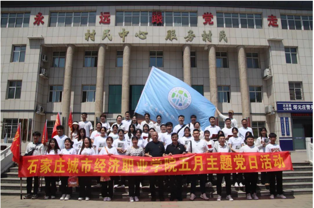
图 7 研学活动图