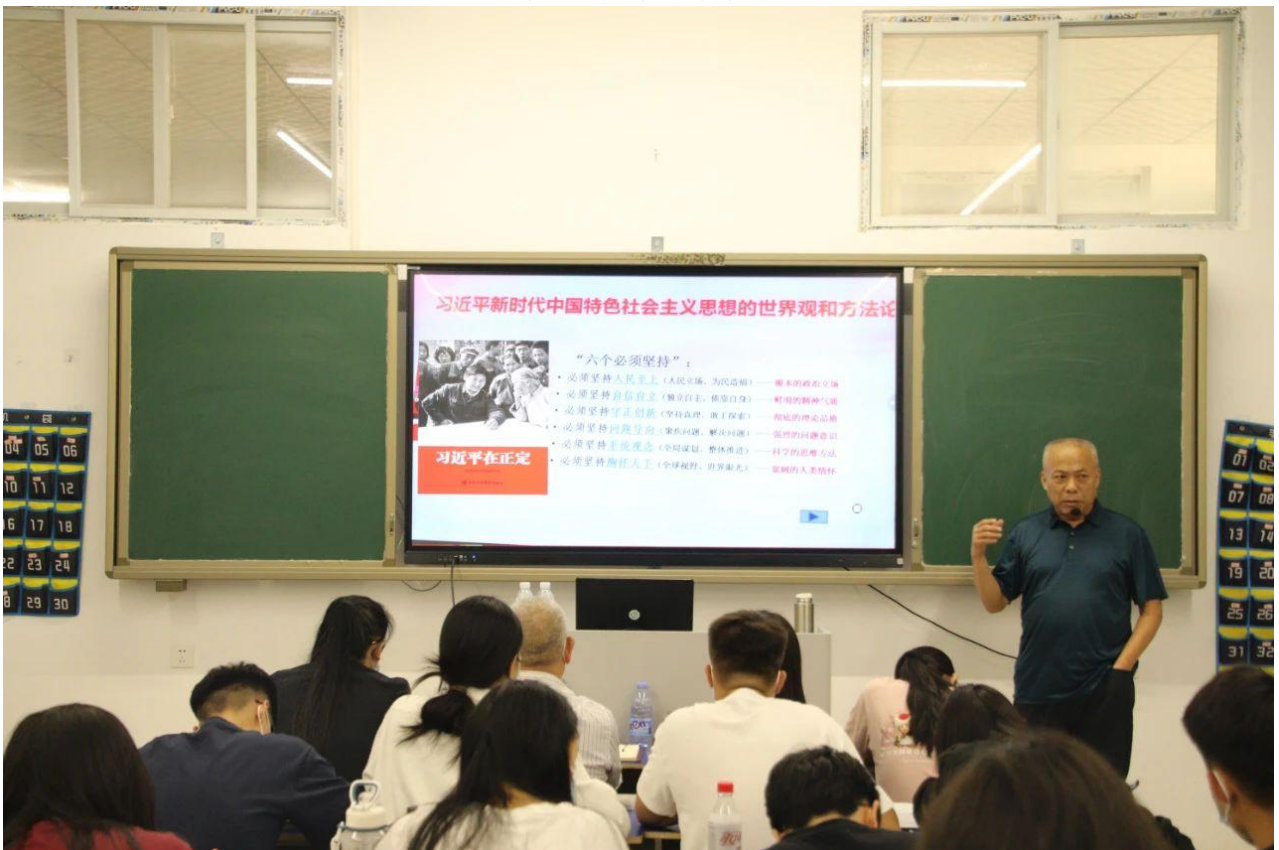
图 8 入党积极分子培训班的开班仪式图