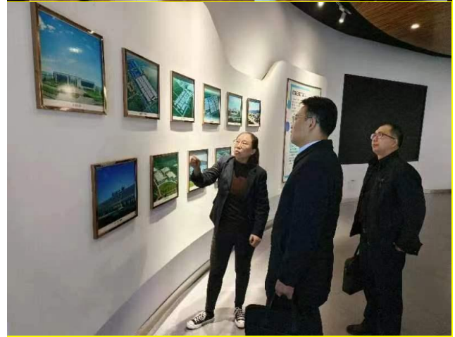
图 13 学院参观药厂、药房图

还与河北旅投国际酒店管理集团有限公司、北京铭扬兄弟影视文化传播有限公司、学而习教育科技河北有限公司、河北欧学教育咨询有限公司、河北子新息