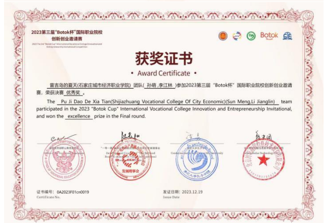
图1 教师、学生参赛“2023 第三届‘Botok 杯’国际职业院校创新创业荣誉证书图