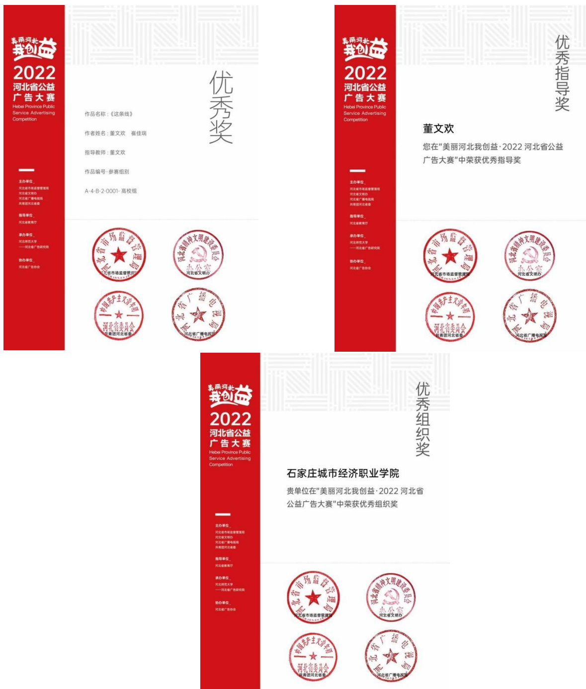
图 4 师生参加“美丽河北我创益·2022 河北省公益广告大赛”获奖图