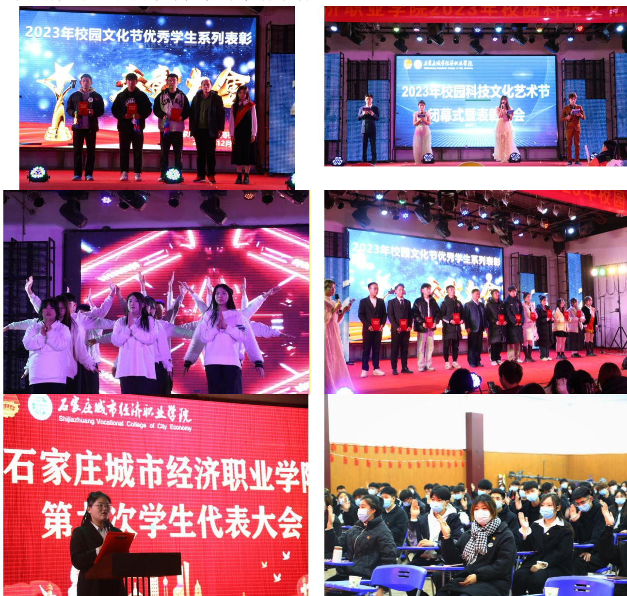
图9 校园科技文化节系列活动

员会、社团联合会为团学组织基础，通过组织多种团学活动，向各系进行延伸。并以此开展了校园科技文化节、“党的二十大、我的幸福时光”征文大赛、“校园好声音”歌手大赛、“喜迎二十大、奋斗新征程”演讲比赛、“我的创意、变废为宝”DIY 创新创业大赛、“校园王者，荣耀之战”王者荣耀比赛、“思辨杯”校园辩论赛、“遇见美好的你”校园青春歌会、“温暖夏日，‘乒’出精彩”乒乓球比赛、“展青春风采”春季田径运动会、“踔厉奋发新时代”班级风采大赛、河北省大学生校园歌手大赛等教育活动。