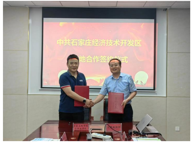
图 12 学院与石家庄经济技术开发区工委组织部签订校地合作