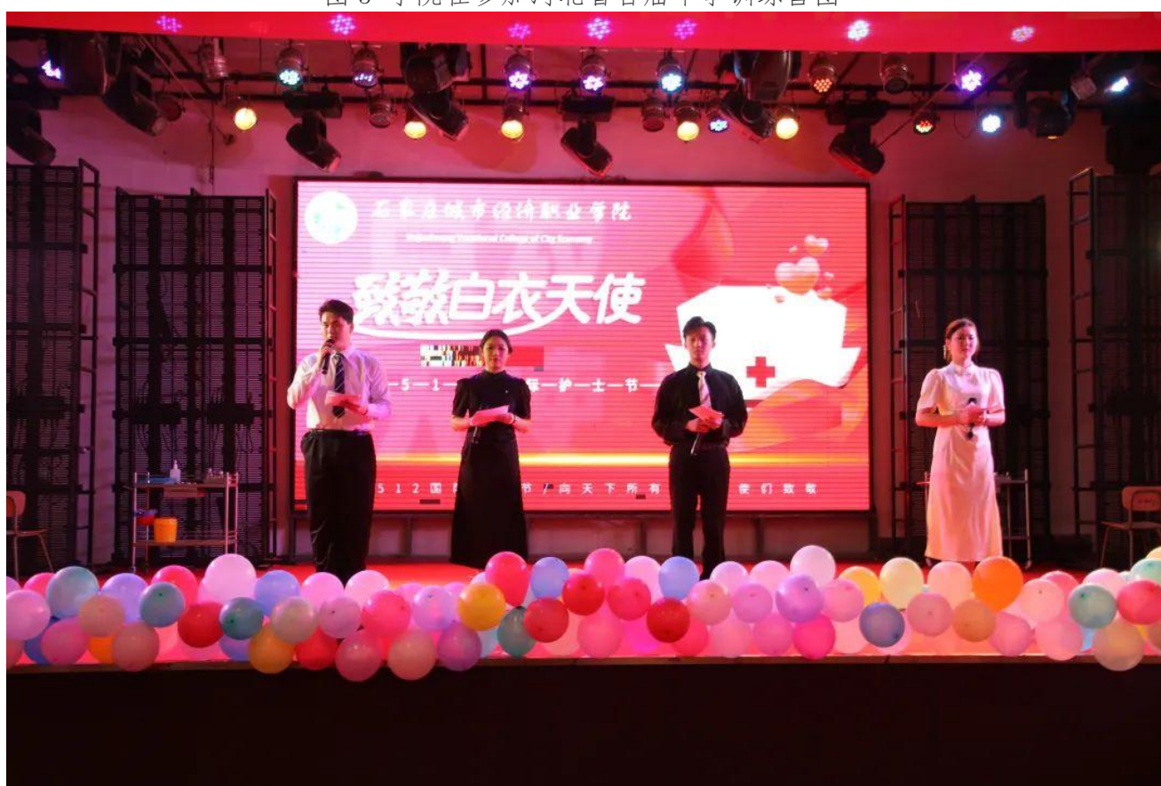
图6 举办“最美白衣天使”——庆祝5·12国际护士节活动图