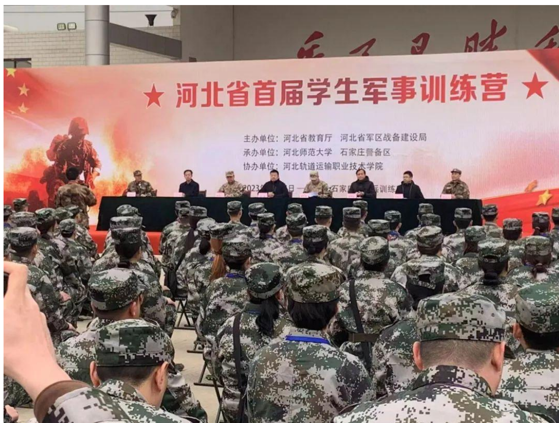
图5 学院在参加河北省首届军事训练营图